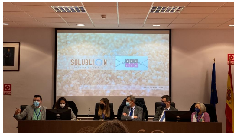
II symposium on chemical and physical sciences for young researchers – Universidad de Murcia

Además, participamos activamente en iniciativas que fomentan la formación en titulaciones STEAM para niñas y mujeres.