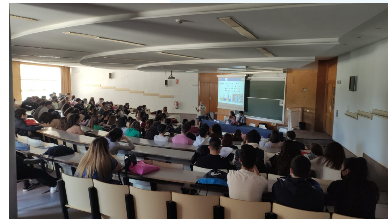
Jornadas de difusión para estudiantes – Universidad de Alicante