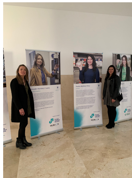
Programa "Emprender con nombre de mujer" del Parque Científico de Alicante