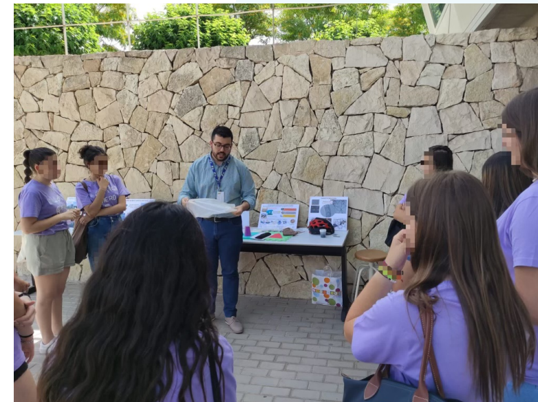
Programa "Quiero ser Ingeniera" de la Universidad de Alicante